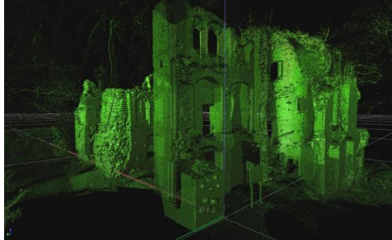
Ruiny zamku rodziny von Dewitz w Dobrej Nowogardzkiej, woj. zachodniopomorskie.

Obecnie w kolekcji znajdują się zdjęcia, chmury punktów, modele 3D i plany 17 zabytków (kościół, zamki, fortyfikacje). Docelowo w kolekcji znajdzie się około 200 obiektów zabytkowych.